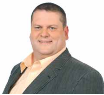
20 | Volker Barth